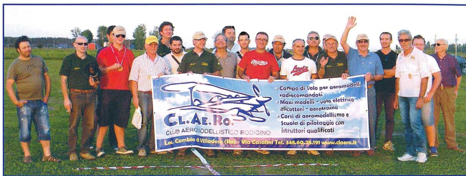
Foto di gruppo

Alla competizione di tipo “open” hanno partecipato un nutrito numero di concorrenti, non solo CLAERO, ma anche provenienti dai campi di volo delle vicine città di Ferrara,