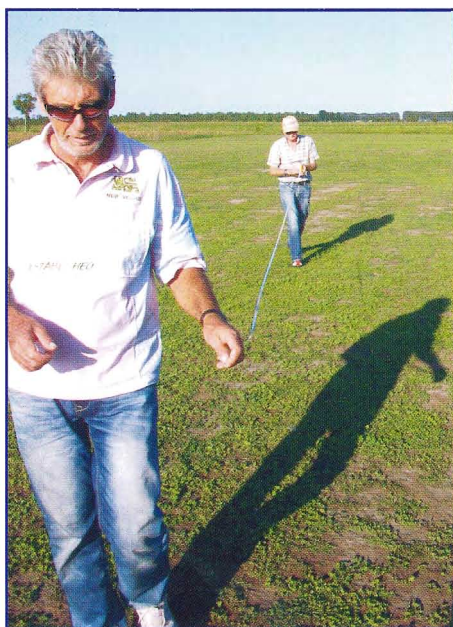
La misurazione della distanza dal “Target”

Adria, Ariano, Bosco Mesola, Codigoro e Cavarzere.