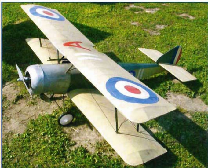
Il Sopwith Camel