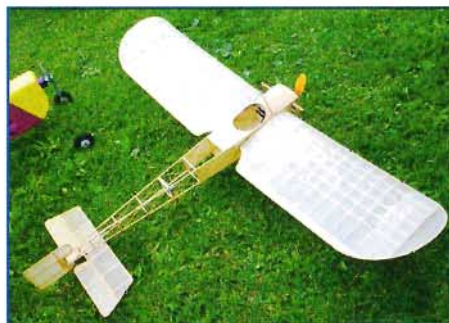
Il Bleriot XI