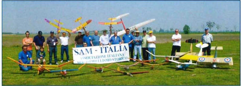
I partecipanti al raduno

Domenica 8 MAGGIO 2011, si è svolta a Cambio di Villadose il "1° Raduno per aeromodelli d'epoca", organizzato dal Club Aeromodellistico Rodigino (CLAERO), in collaborazione con l'Associazione Italiana Aeromodellismo Storico SAM-ITALIA..